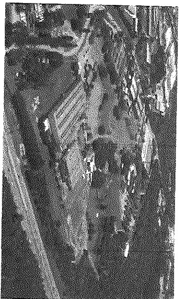
Gravataí – RS (38 anos)

Suas principais atividades se relacionam com as do Grupo Dana (tecnologias de transmissão, vedação, e gerenciamento térmico).